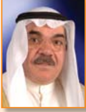
م. موسى عبدالله الصراف عضو المجلس البلدي ووزير سابق