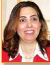
رولا عبدالله دشتي عضو مجلس الأمة الكويتي