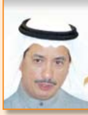
د. يوسف الابراهيم وزير سابق ومستشار في مكتب سمو أمير البلاد