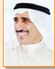
محمد حمد الرومي وكيل الديوان ديوان الخدمة المدنية