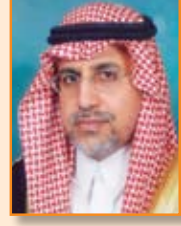
الأمير الدكتور خالد بن عبدالله بن مقرن آل سعود عضو مجلس الشورى السعودي